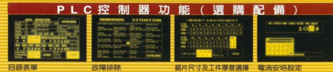
PLC 控制器功能 (選購配備) 目錄表單 故障排除 鋸片尺寸及工件厚度選擇 電流安培設定