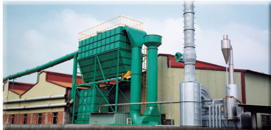
濾管式集塵機 FILTER TYPE DUST COLLECTOR