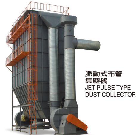
脈動式布管 集塵機 JET PULSE TYPE DUST COLLECTOR