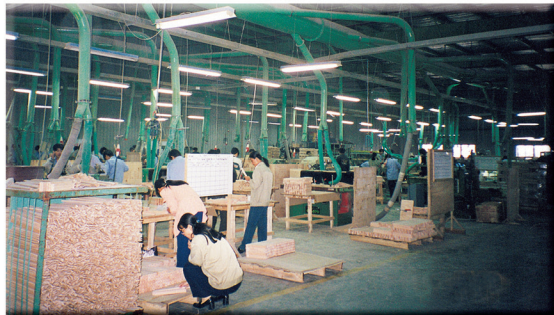
吸塵風管系統 DUCT SYSTEM FOR DUST COLLECTING