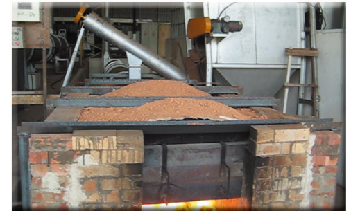
溼木屑由網篩過濾後投入烘乾爐製程設備 THE WET WOOD FLOUR IS PERCOLATED, AND THEN SENT TO THE DRYER