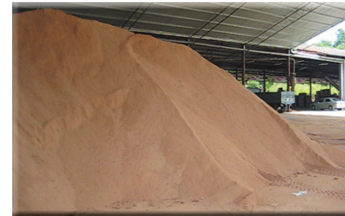
溼木屑原料廠 WET WOOD FLOUR