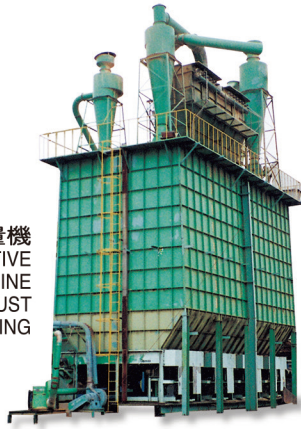
木屑儲存定量機 QUANTITATIVE MACHINE FOR DUST COLLECTING