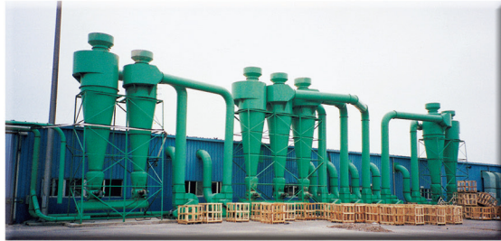
中央系統吸塵設備 CENTRAL SYSTEM EQUIPMENT FOR DUST COLLECTING