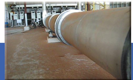
木屑乾燥滾桶設備流程 WET WOOD FLOUR DRYER