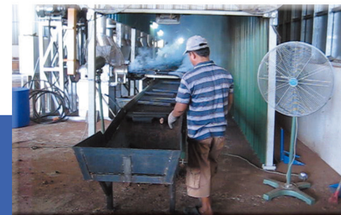
原子炭製造流程後段成品 FINISHED PRODUCTS