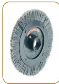
YL-1200G · YL-1000AG 固立特砂輪 Grit sander (選配附件Opt.)